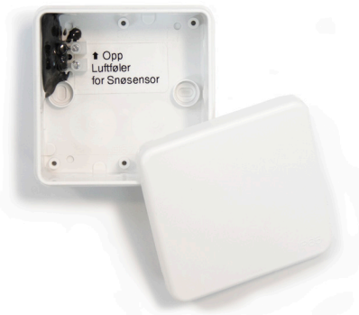
ØS Snøsensor luftføler. El. nr. 54 705 31

ØS Innstøpningsboks for ØS Snøsensor SMC-2. Innstøpningsboksen støpes ned sammen med varmekablene og elektriker kan dermed påse at bakkeføleren kommer i riktig høyde når denne installeres. Andre fordeler er ved splittet entrepris eller ved eventuell utskifting av bakkeføler. Denne inngår i El. nr. 54 706 25