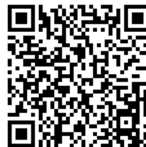
ØS Tak- og takrennesensor