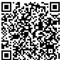
ØS Frostsikrings- termostat 20A - DIN

For mer utfyllende informasjon se følgende manualer: